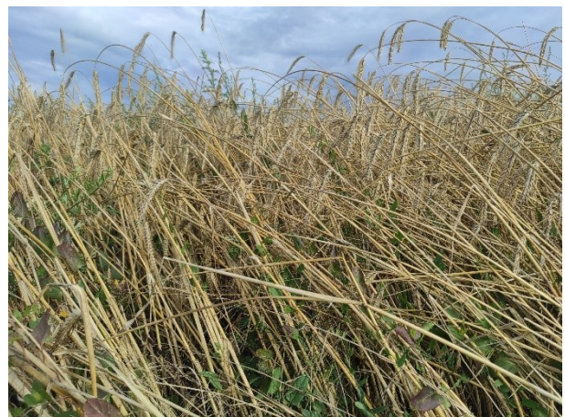
Beispiel 4: Detailfoto von Roggen, die einzelnen Pflanzen sind gut erkennbar