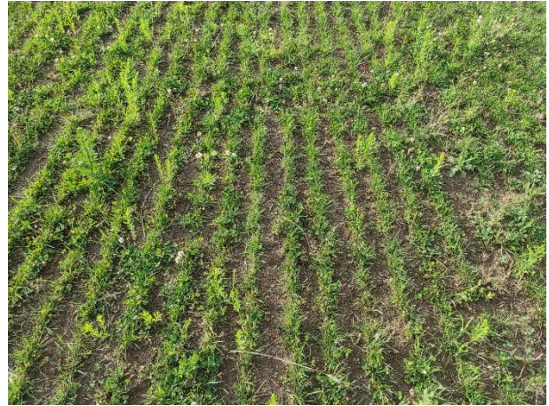
Beispiel 6: Detailfoto eines Ackergrasbestandes