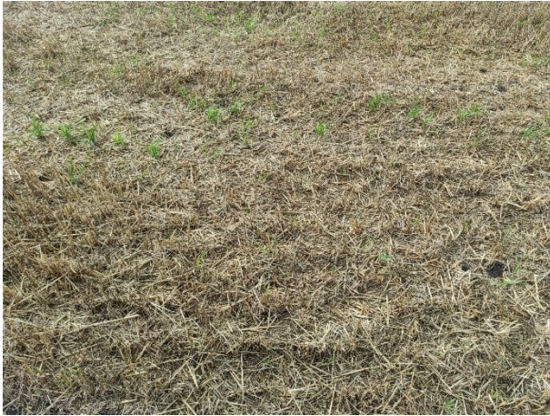
Beispiel 5: Detailfoto eines abgeernteten Bestands, die Erntereste sind noch erkennbar