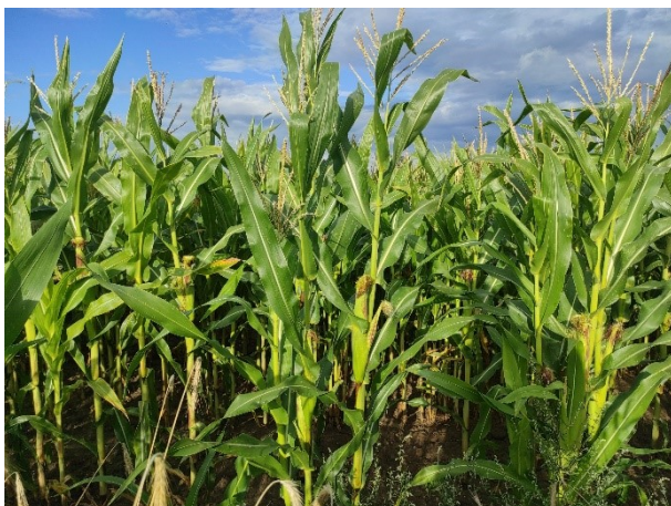
Beispiel 3: Detailfoto von Mais, die einzelnen Pflanzen sind gut erkennbar