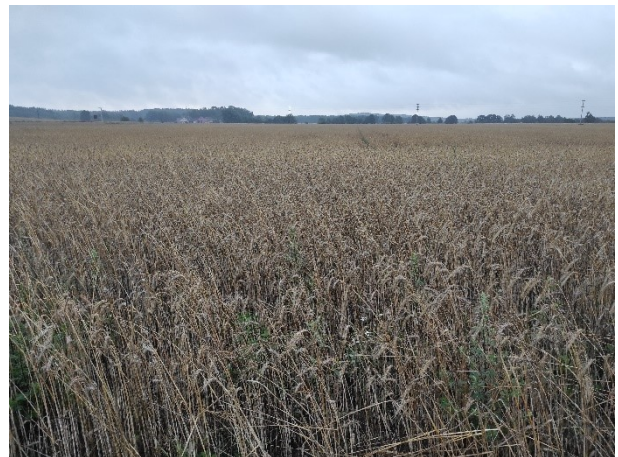
Beispiel 2: Überblicksfoto Roggen