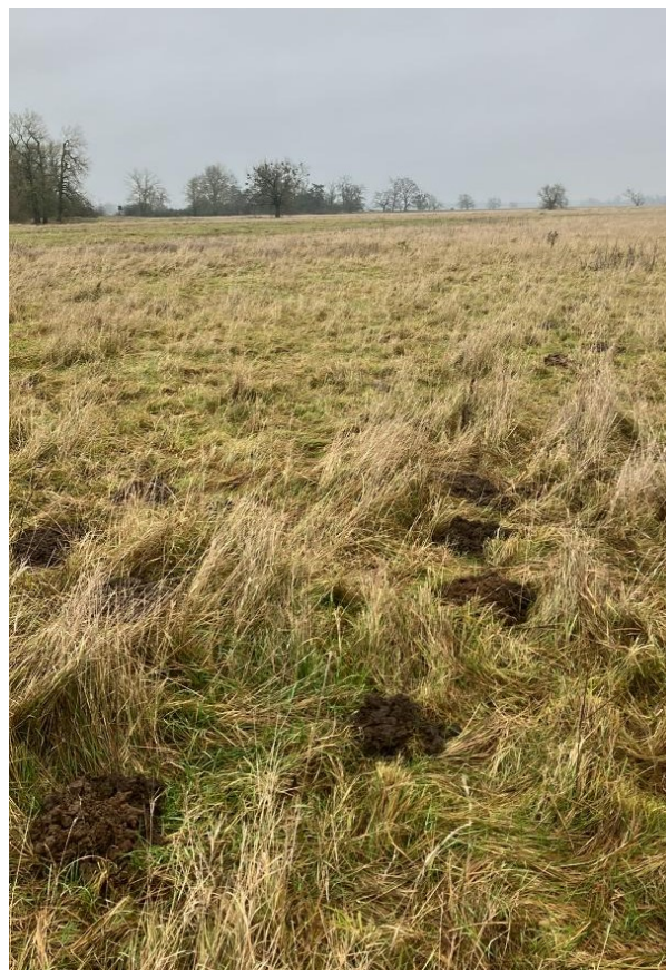
Beispiel 11: fehlerhafte Aufnahme, die Altgrasfläche ist zwar zu erkennen, die Grenze zum bewirtschafteten Grünland ist aber nicht sichtbar.