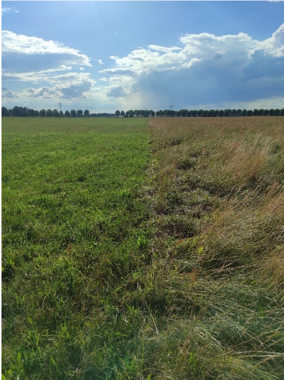
Beispiel 8: Korrekte Aufnahme, Standort auf der Grenze und Aufnahme entlang der Grenze zwischen dem bewirtschafteten Grünland und der Altgrasfläche. Die Altgrasfläche ist eindeutig erkennbar.