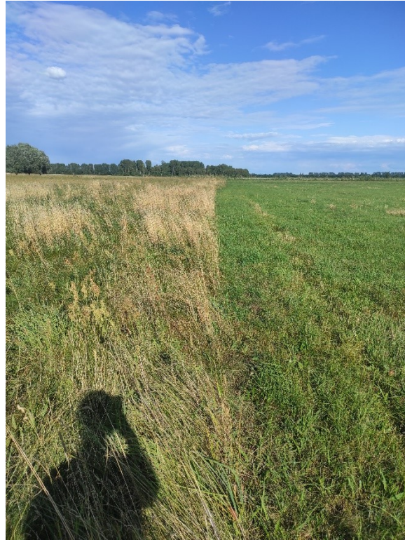
Beispiel 9: Korrekte Aufnahme, Standort auf der Grenze und Aufnahme entlang der Grenze zwischen dem bewirtschafteten Grünland und der Altgrasfläche. Die Altgrasfläche ist eindeutig erkennbar. Ein Schattenwurf ist unproblematisch