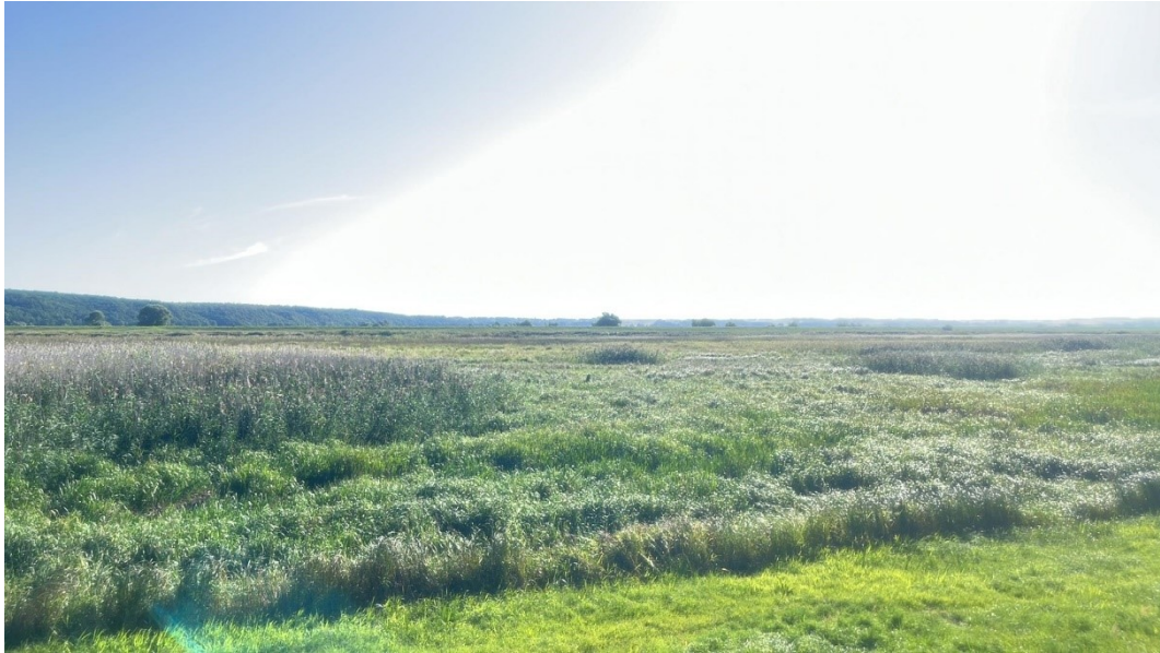
Beispiel 10: Annehmbare Aufnahme, die Altgrasfläche ist zu erkennen, ebenso die Grenze zum bewirtschafteten Grünland