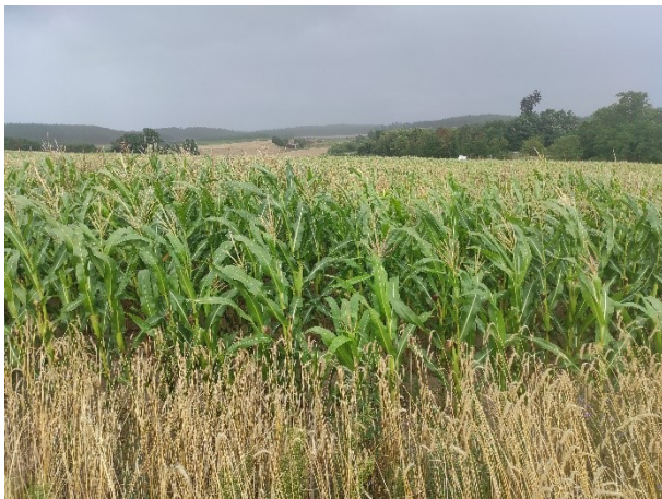
Beispiel 1: Überblicksfoto Mais